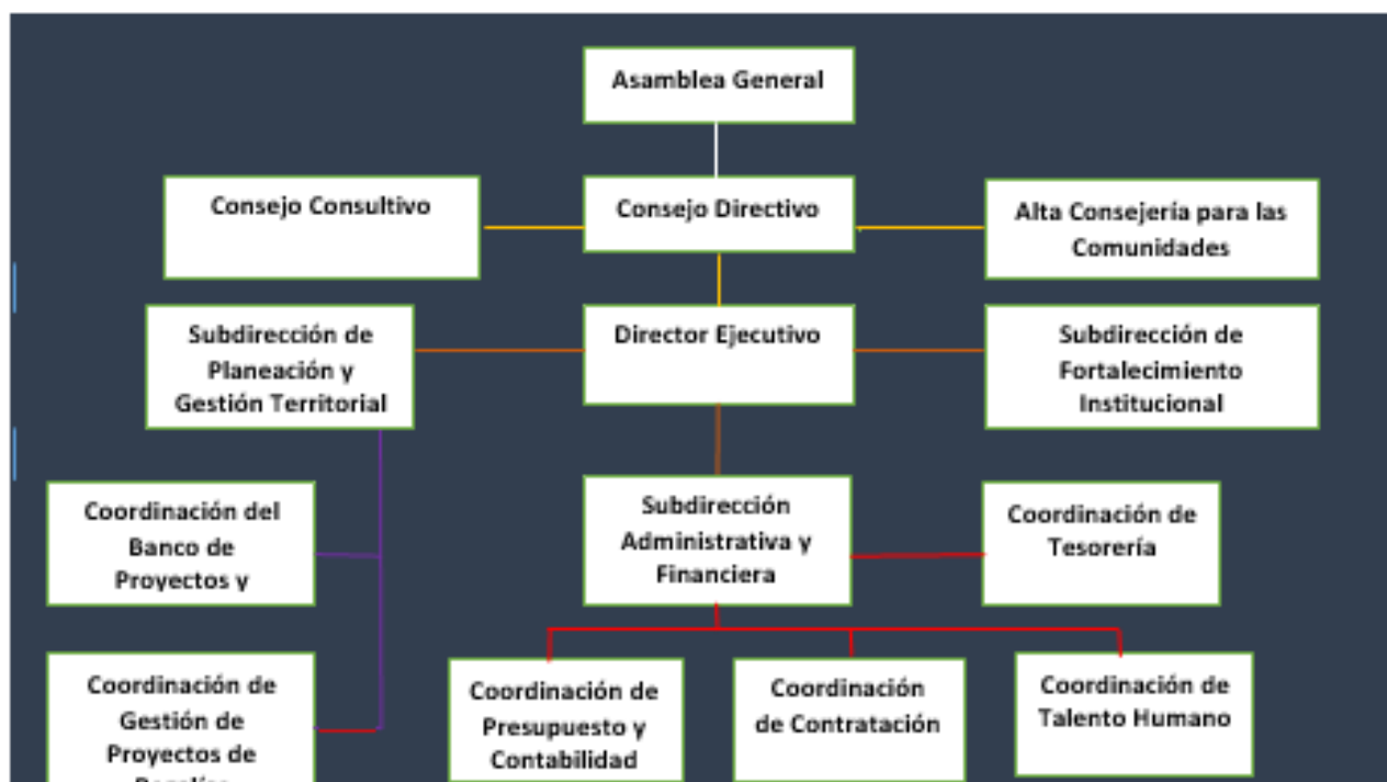
Ilustración 2: Estructura orgánica y administrativa de LA GUAJIRA ZONA SUR

La estructura orgánica y administrativa aprobada por el Concejo Directivo de LA GUAJIRA ZONA SUR, es la presentada en la ilustración 1.